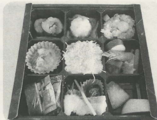
地区大会用弁当(中身)